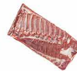
PANCETA BACON EXTRA