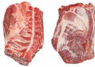
AGUJAS CON HUESO