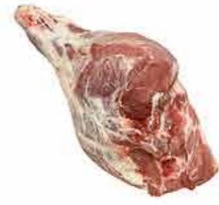
JAMÓN TIPO YORK