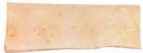
TOCINO DE LOMO