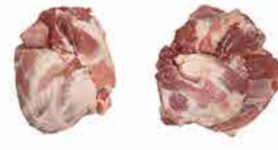
PALETA SIN HUESO 4D