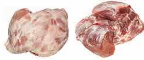
JAMÓN DESHUESADO 4D