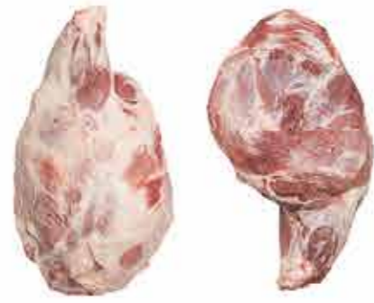
PALETA T. YORK C/C