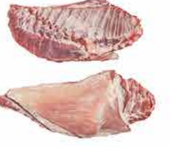
COSTILLAR CARNUDO (EXTRA)