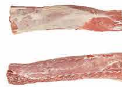
CINTA DE LOMO EXTRA