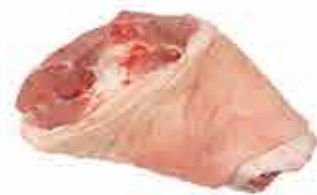
CODILLO DE PALETA