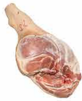
JAMÓN REDONDO SIN PATA