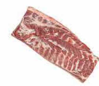
PANCETA SIN COSTILLAS