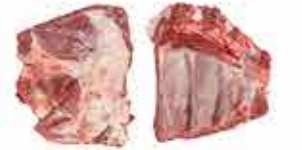
PUNTAS DE COSTILLAS