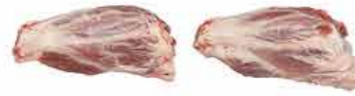
CODILLOS DE JAMÓN