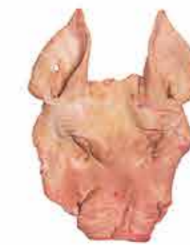
MORRO CON OREJA