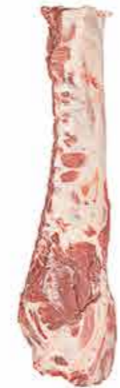
CHULETERO CON AGUJA