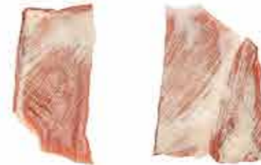
SECRETO LOMO BLANCO