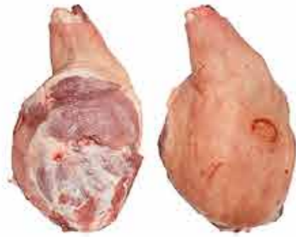
PALETA REDONDA SIN PATA