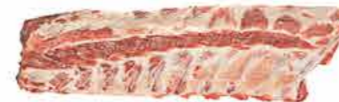
TIRAS DE COSTILLAS