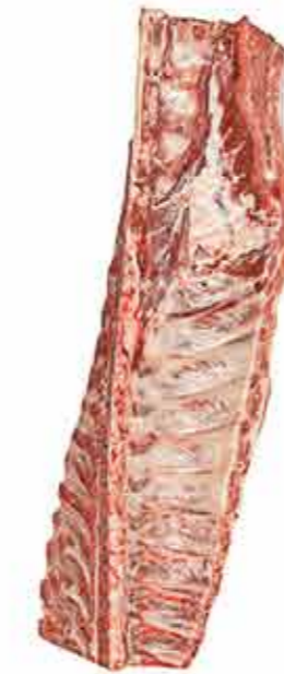
CHULETERO SIN AGUJA