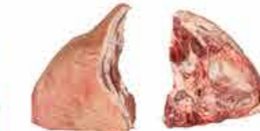
PAPADA CON CORTEZA