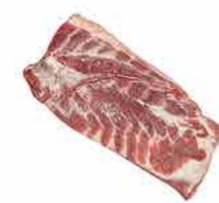
PANCETA CON COSTILLAS